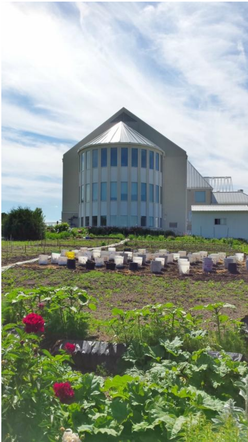
En el jardín del Monasterio Madre de Dios se ubica un sensor de temperatura.