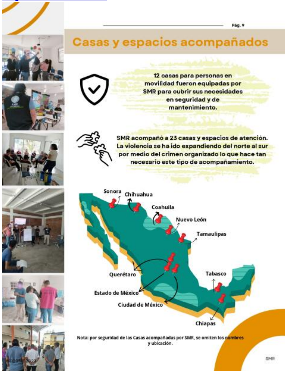
Infografía: Informe SMR