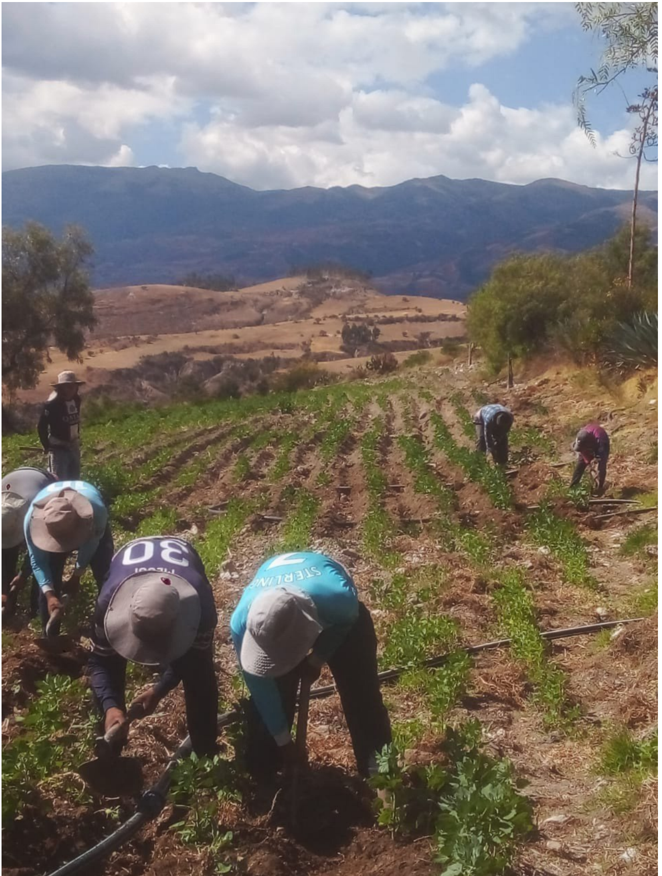
Agricultores aporcan la quinua en Tambillo-Ayacucho.