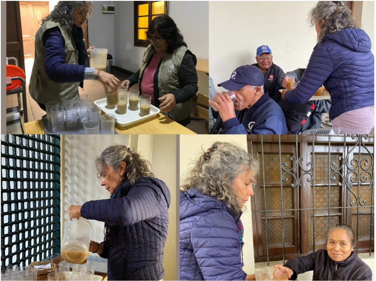
Voluntarios sirven la quinua en el encuentro de misericordia en el Monasterio de la Encarnación.