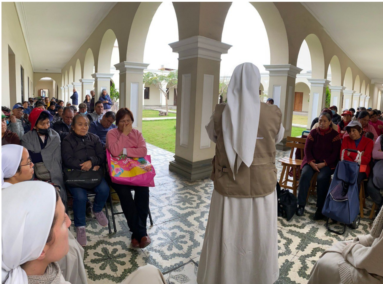
Hermanas oran en el encuentro de misericordia.