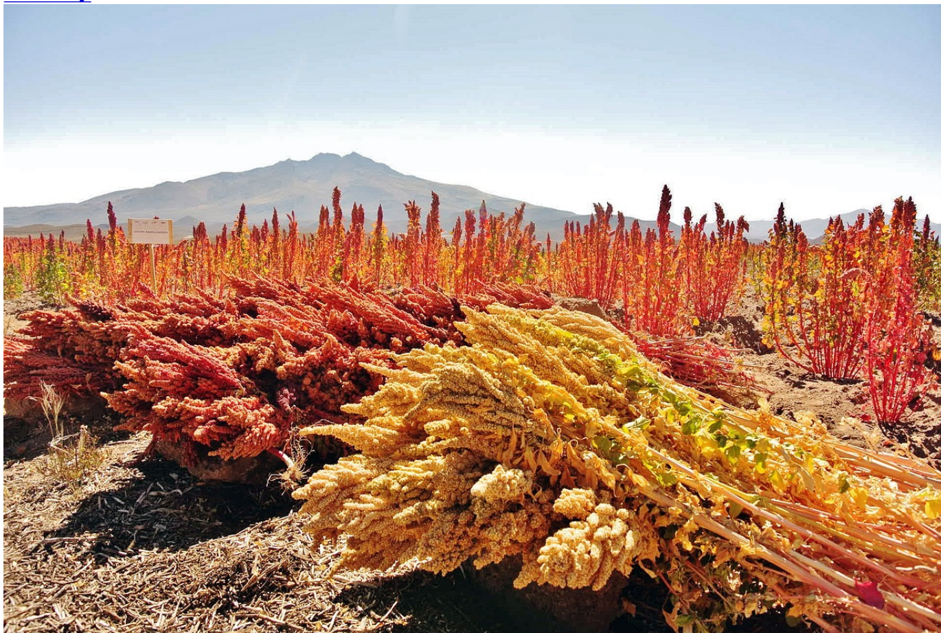
Cultivos de quinua en los Andes.