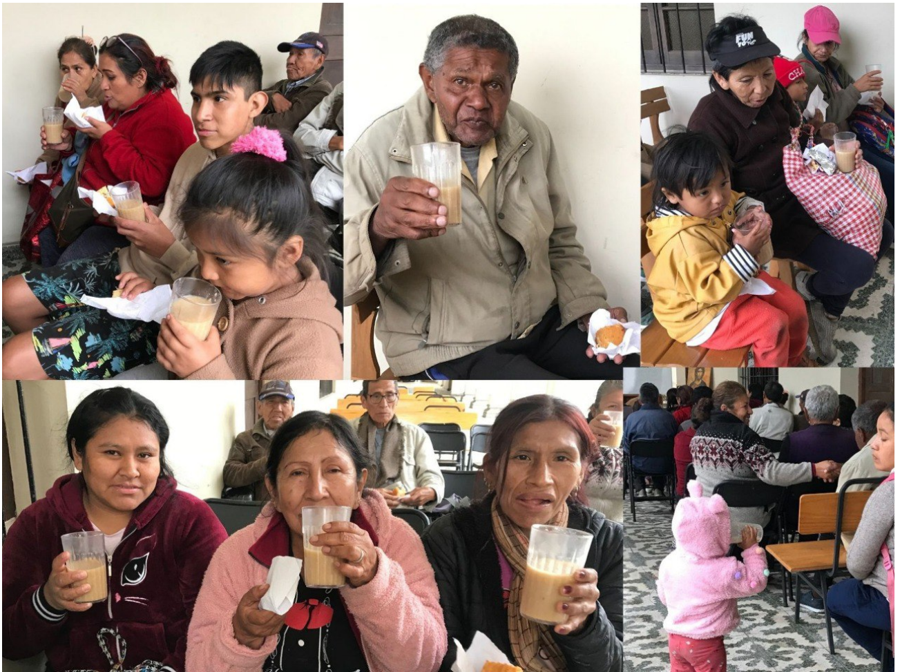
Participantes del encuentro de misericordia beben la quinua carretillera.