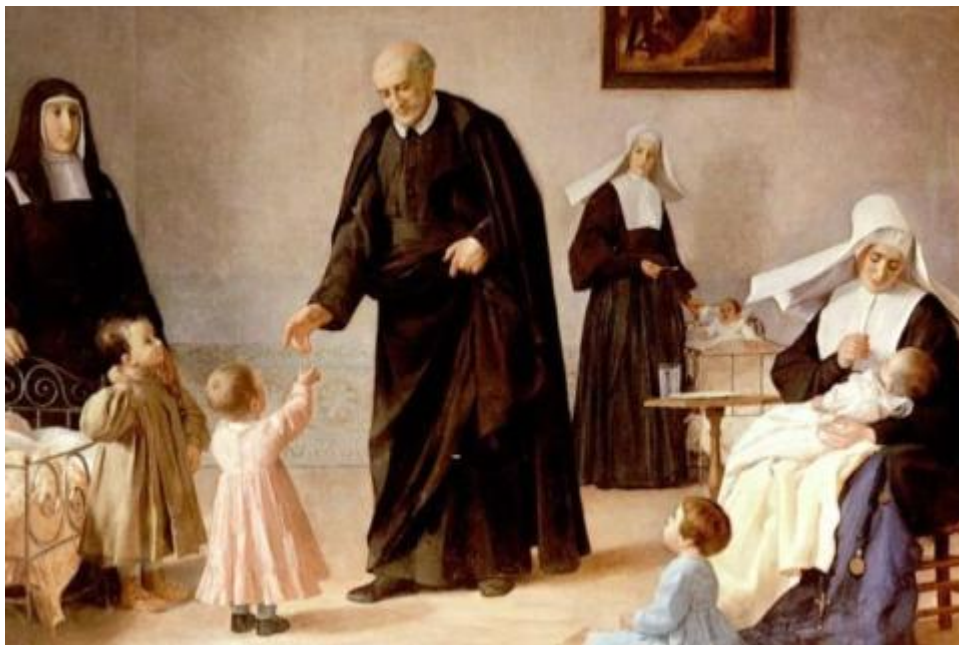
Representación pictórica de san Vicente de Paúl. Autor: Anónimo /Año publicación original: 1963/ Fuente: Anales españoles. (Foto: cortesía vincentians.com/es)

Este hombre de Dios se dejó tocar hasta la médula por un Maestro que pide asumir la cruz, levantarla y hacer suya la de otros. No es tan sencillo, y lo sabemos bien los cristianos que, entre luces y sombras, hacemos opción por seguir también las huellas del Resucitado con sus marcas de crucificado para que, sin masoquismo y con entereza, no se nos olvide que la vida en esperanza va tocada por el dolor propio y el ajeno.